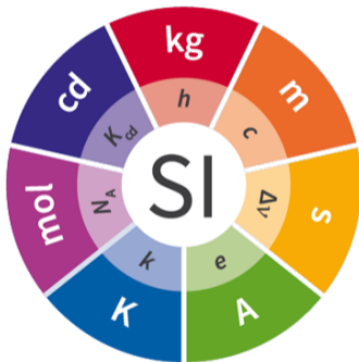
Abb. 1: SI Basiseinheiten [1]